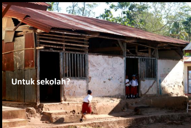
kemandirian hidup di desa pun melemah.

Sementara itu, masalah pendidikan formal masih diwarnai kurang maksimalnya kinerja sekolah seperti kelas lebih sering kosong, guru sering berganti-ganti dan kegiatan guru yang justru terkonsentrasi pada urusan administrasi pendidikan daripada fokus pada pelayanan dan perhatian untuk anak didik. Metode pendidikan yang digunakan di sekolah pun sering tidak kreatif sehingga tidak mampu mendorong siswa aktif belajar dan aktif berpartisipasi dalam kegiatan ekstrakurikuler. Sementara itu komunikasi antara lembaga sekolah dengan orang tua murid pun sering tidak berjalan, sehingga partisipasi orang tua dalam pengembangan pendidikan di sekolah relatif rendah. Dapat disimpulkan, justru ketika sekolah sebagai ujung tombak pendidikan nasional belum dapat menjamin kelangsungan hidup di desa, komunitas adat yang seharusnya mampu pendidikan keterampilan hidup malah mangkir. Pengetahuan dan keterampilan hidup sehari-hari terabaikan. Akibatnya ketahanan dan