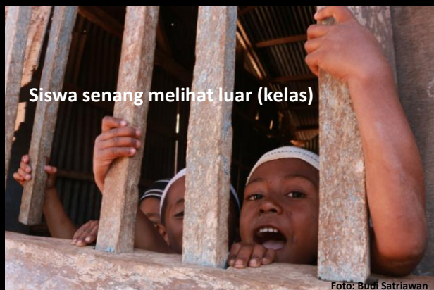
Siswa senang melihat luar (kelas)