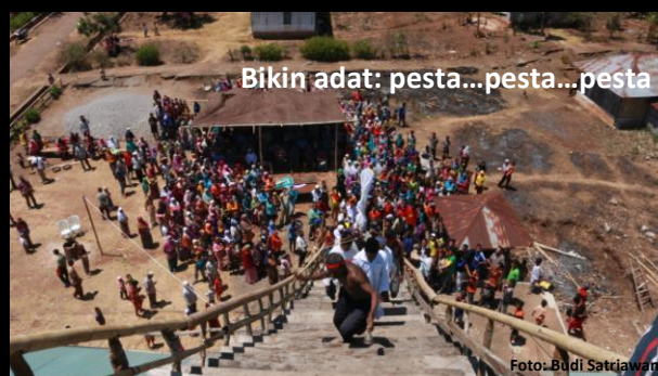
Bikin adat: pesta...pesta...pesta

Harus diakui bahwa bagaimana pun adat adalah media reproduksi sosial, artinya proses kelangsungan hidup berkomunitas tergantung pada kemampuan adat menyelenggarakan pendidikan untuk anak-anak adatnya sampai mereka “tahu adat”. Pendidikan dilakukan warga masyarakat adat secara kekeluargaan sambil memecahkan persoalan hidup sehari-hari. Hasilnya adalah anak-anak adat yang mampu/terampil memecahkan soal hidup sehari-hari. Dalam pola ini, pendidikan tidak terlembagakan secara khusus seperti